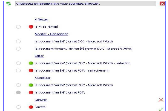
Check-list des étapes