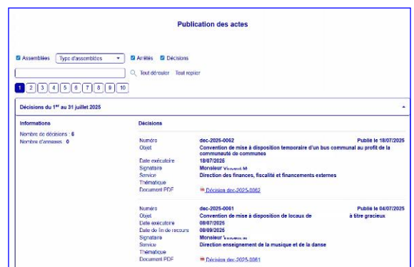
Publication des actes